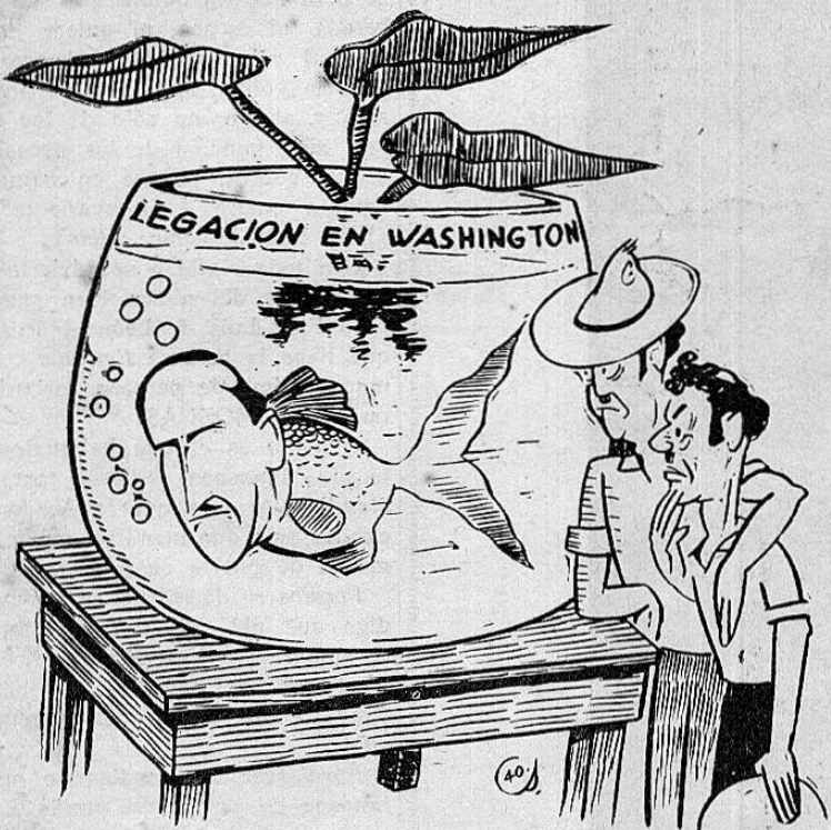
Es una herencia dorada que nos tocó de don León,

y en aguas de UASINTON simplemente, NADA... NADA...!